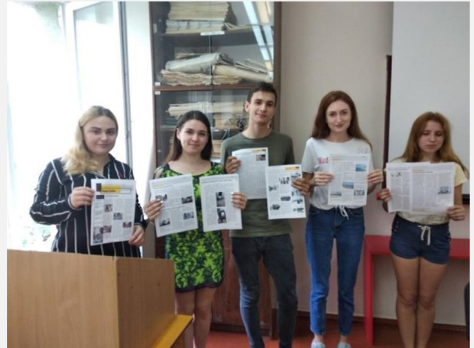
Студенти-журналісти ХДУ презентують власні навчальні видання

http://www.kspu.edu/About/Faculty/PhilologyJournalizm/ChairJournalism/Studentgazeta.aspx